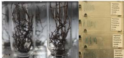
Figura 4. Raicillas secundarias para coloración y placas para observación de colonización por micorrizas en plantas de leucaena.

Diámetro de los nódulos: 1,00 = 1 a 2 mm; 2,00 = 2 a 3 mm; 3,00 = 3 a 4 mm; 4,00 = 4 a 5 mm; 5,00 = 5 a 6 mm; 6,00 = 6 o más mm.