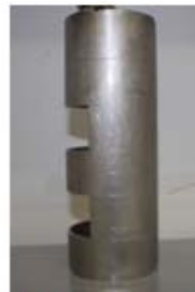
Figura 1. Barreno de acero inoxidable con las cinco profundidades (cada 4 cm).

La metodología utilizada para la determinación de Rhizobium fue la propuesta por Bradley & Nolt (1988), que consiste en realizar perforaciones al suelo con la ayuda de un barreno de acero inoxidable sección redonda (3" de diámetro), el cual es introducido a golpe de martillo, separado a 10 cm del fuste de la planta. El barreno posee varias aberturas laterales, las cuales indican cinco profundidades: 0, 4, 8, 12, 16 y 20 cm (Figura 1).