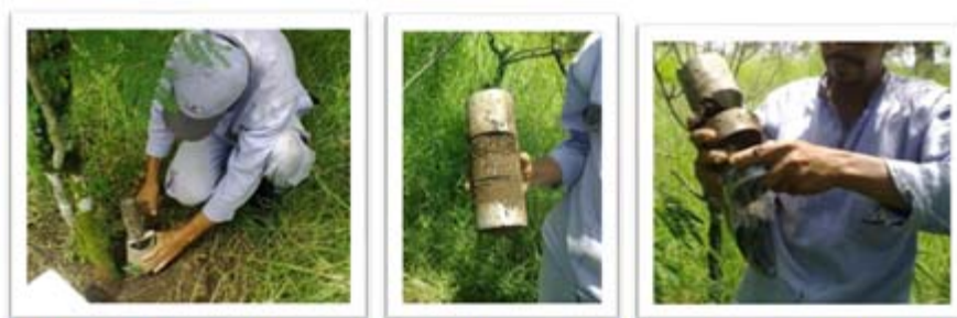
Figura 2. Toma de muestra con el barreno a 10 cm del fuste del árbol.

La evaluación del color interno del nódulo se realizó a través de un corte transversal; tonalidades rojizas determinan fijación de N activa; tonalidades blancas representan actividad no funcional, los nódulos rotos o vacíos no fueron tomados en cuenta.