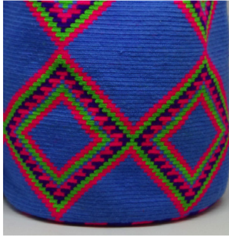
Figura 7. Fotografía de mochila wayúu modelo 1, detalle del patrón en la base.