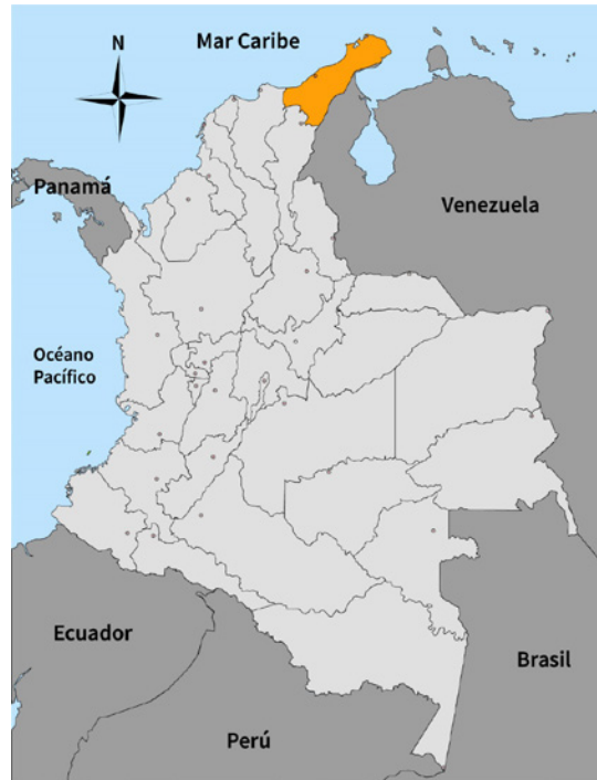
Figura 1. Divisiones departamentales de Colombia, ubicación del departamento de La Guajira. Nota: elaboración propia.

Las mochilas wayúu son productos comunes en Colombia y hacen parte de las artesanías que se comercian y exportan constantemente. Son un ingreso para muchos hogares de esta comunidad, pero se comercian en condiciones desfavorables. La producción de una mochila puede durar entre 10 y 14 días en manos de una tejedora experta y al momento de pasar a la venta, la tejedora está limitada a dos mercados: la venta personal, desplazándose a un casco urbano o la venta a través de un comprador inmediato. En ambos