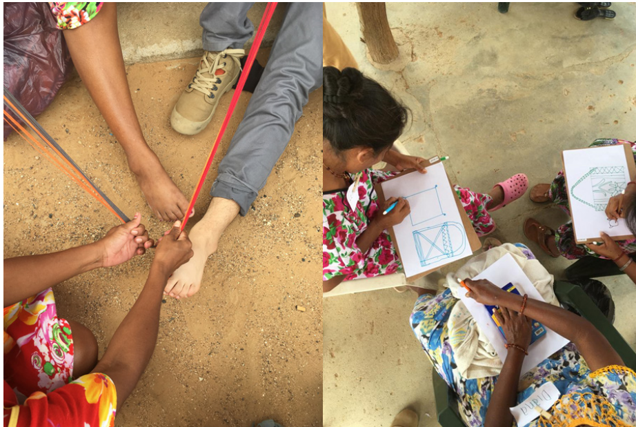
Figura 3. Escenarios de participación diseñador-tejedora en actividades de tejer y dibujar. Nota: elaboración propia.

Nosotros aprendimos a tejer y las tejedoras bocetaron durante los talleres de diseño (Figura 3). La creatividad y dominio de las paletas de colores de las tejedoras era magistral y esto fue patente en sus dibujos y prototipos, mientras que nuestros intentos de tejido dejaban mucho que desear. Pero la intención no fue que uno adquiriera la maestría del otro, la extensión de tiempo de los talleres (una semana cada uno) lo habría impedido de todas formas. El objetivo de que intercambiáramos técnicas era que la experiencia corporal nos ayudara a formar nuestras explicaciones.