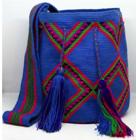
Figura 6. Fotografía de mochila wayú modelo 1. Nota: elaboración propia.

Todos los patrones se construían siguiendo las relaciones de color y las relaciones de posición respecto al ciclo anterior. Si lo que al diseñador le interesa es la relación entre formas, la tejedora se ocupa de las relaciones entre puntos, en el lugar del tejido en el que acontece el punto de croché presente. Son las relaciones de cada punto con la composición general los que crean figuras, no una progresión rígidamente planeada, sino un ritmo que depende de una intención previa y de los puntos circundantes, con operaciones matemáticas involucradas en varias instancias. Ahí donde priman las relaciones entre puntos por color y posición van apareciendo patrones que, en ocasiones, no son fáciles de ver como figuras y fondos.