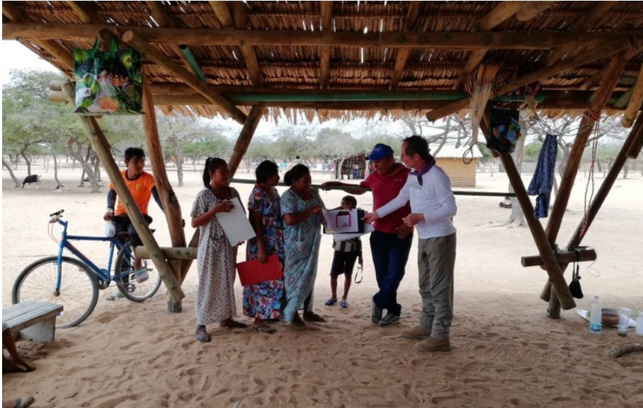
Figura 2. Fotografía de la primera visita de campo. Nota: elaboración propia.

Además de ejercicios donde las tejedoras dibujaban productos a partir de insights del mercado que traíamos los diseñadores, hubo una dimensión de análisis de sus respuestas apoyados en el marco conceptual que ya nombramos. Si la antropología simétrica busca una explicación que muestre conocimientos y creencias como términos que se aplican a ambos grupos, un diseño simétrico debe buscar establecer empíricamente las diferencias de prácticas experimentales con materiales (descripción que aplica tanto para la artesanía como para el diseño industrial). Sólo aprendiendo la técnica que corresponde se pueden dar explicaciones sobre un diseño diferente.