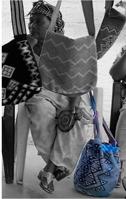
Figura 4. Patrones de triángulos en mochila wayúu. Nota: elaboración y edición propia.

Del mismo modo en que Albarrán González (2020, p. 177) determina a los tejidos como aquellos “libros que no pudo quemar la colonia”, estudiemos entonces cómo surgen los patrones de estos productos. Lo primero es que ellas no tejen con círculos consecutivos, que es como otras tejedoras de croché lo harían en otras partes del mundo, sino con dos tipos de espirales (Figura 5). La primera plana, la segunda cilíndrica.