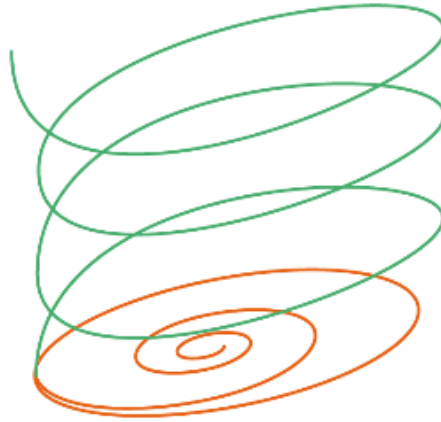
Figura 5. Esquema de construcción de las mochilas wayúu. Nota: elaboración propia.

Los patrones como el que vemos en la Figura 6 se tejen de abajo hacia arriba. Mientras estaba tejiendo, la tejedora repartió las puntas inferiores del rombo en color rosado. Para que los rombos tengan el mismo tamaño y se junten a la misma altura, la tejedora tuvo que estimar un número de puntos de croché por ciclo y dividirlo por el número de rombos que obtendría. En este caso la operación sería de 330 dividido por 5, es decir, 66 puntos entre punta y punta del rombo. Después comenzó a subir hasta que los rombos se unieron. Durante cada ciclo la tejedora desplazó un punto de color a la izquierda o a la derecha con respecto a los puntos del ciclo anterior y fue cambiando de color dependiendo del patrón que se había formado en los ciclos anteriores (Figura 7), lo que explica también por qué se unen de la forma que vemos en sus puntas.