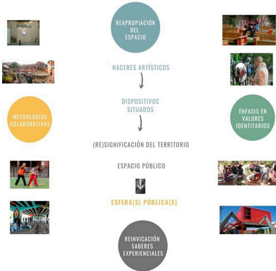
Figura 6. Mapa visual de la relación entre los ejes de la investigación y las constantes detectadas. Nota: elaboración propia.