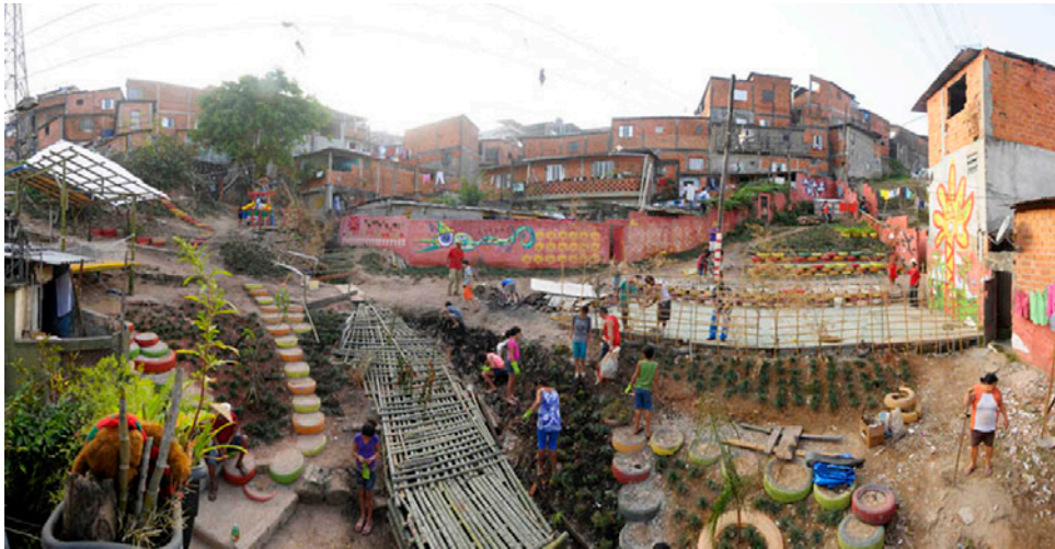
Figura 3. Contrafilé. (2011). Parque para brincar e pensar (intervención artística). Brasil (São Paulo). Nota: http://parqueparabrincarepensar.blogspot.com/