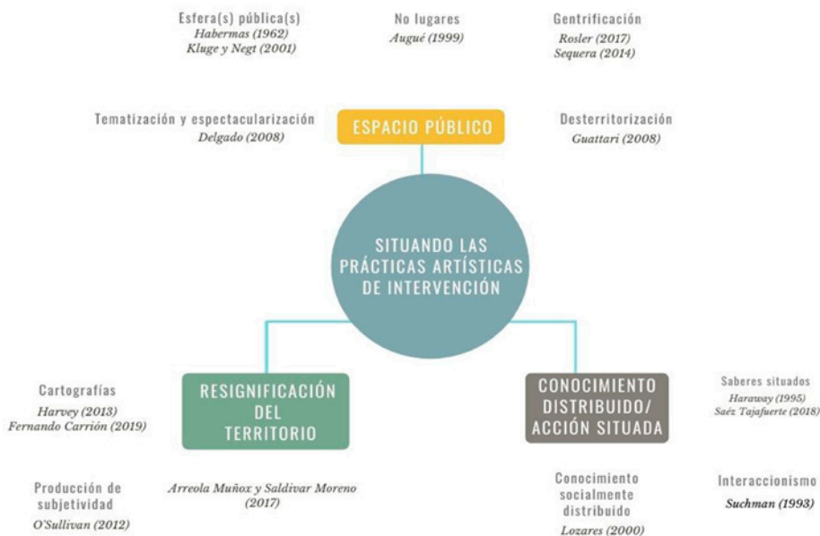
Figura 2. Mapa visual de conceptos clave de la investigación y referentes principales. Nota: elaboración propia.