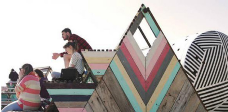
Figura 4. Intermediae. (2014). Paisaje sur. Autoconstruyendo Usera-Villaverde (intervención artística). Madrid (España). Nota: https://www.intermediae.es/proyectos/paisaje-sur-autoconstruyendo-usera-y-villaverde

Todas estas iniciativas inciden, así mismo, en la potenciación de los valores identitarios vinculados al territorio. Los lazos con el pasado y la conformación de otro posible presente es uno de los ejes de actuación de este tipo de propuestas. El proyecto “Autobarrios” 6 , promovido por Intermediae y el colectivo Basurama es un proyecto de participación colectiva que pretende reforzar la comunidad madrileña a partir de propuestas creativas. Es fundamental dentro de sus modos de hacer, el trabajo de proximidad que permite fomentar el imaginario colectivo como herramienta para el empoderamiento. Tres son los ejes que definen el proyecto: la idea de creatividad aplicada, herramienta para el desarrollo comunitario, la puesta en valor de los recursos locales y el trabajo en red. Una de las acciones colectivas desarrolladas es “Paisaje sur- Autoconstruyendo Usera Villaverde” (2014) (Figura 4), un proyecto junto con Intermediae, que trata de conjugar distintas intervenciones de diferentes colectivos, con los vecinos del barrio de Usera Villaverde (Madrid), para recuperar espacios en desuso, degradados y posibilitar nuevos usos y significados.