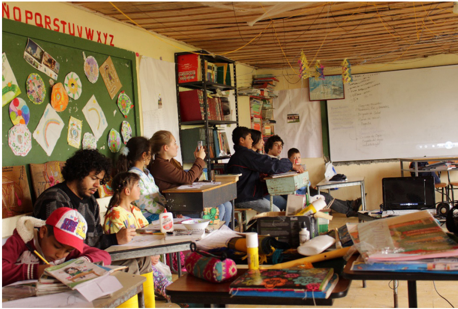
Figura 3. Visita a Escuela Londoño Jaramillo Villamaría, Caldas, 2014.