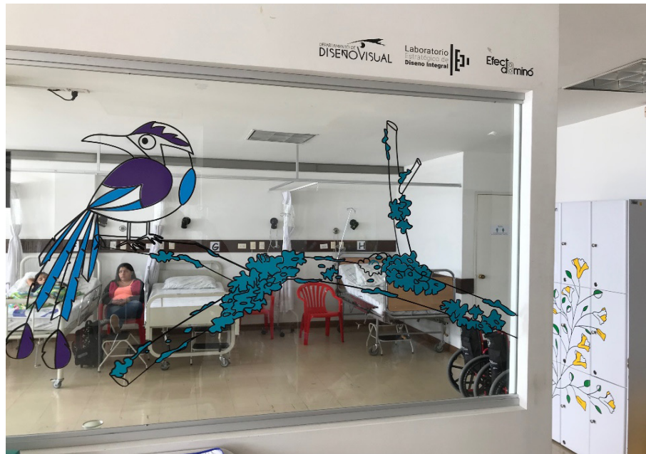
Figura 4. Sala de ingreso a cirugía, Hospital Infantil "Rafael Henao Toro", Manizales, 2017.

Como con los anteriores, se han realizado acompañamientos a proyectos de la Vicerrectoría de Proyección como el del barrio Villa Hermosa y Aguas de Manizales, en la exploración de alternativas para embellecer el barrio; el trabajo en la vereda el Águila km 5 vía Neira con la comunidad del sector y la Junta de Acción Comunal; apoyando el semillero dancístico de la universidad; asistiendo a trabajo en la comunidad del municipio de Filadelfia (Caldas) y apoyando actividades de la Casa de la Cultura y el encuentro de escritores.