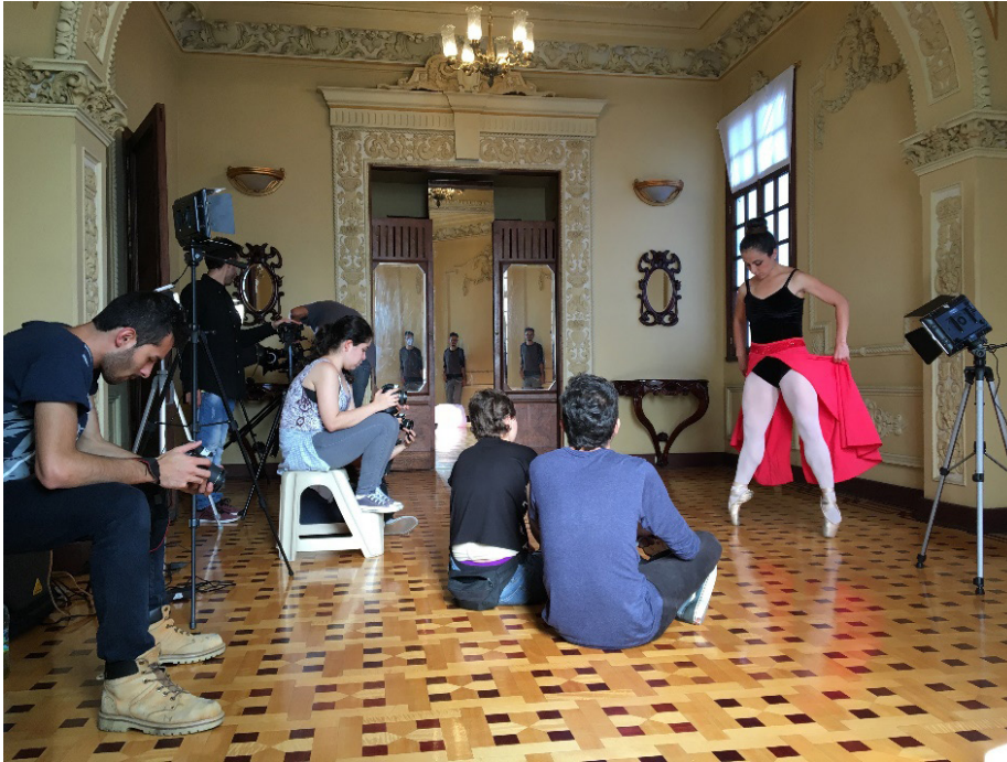
Figura 2. Grabación del video “El sueño”, banda Fúnebre, para Manizales Grita Rock . Locación: Gobernación de Caldas, 2016.

En el caso de la colaboración con la Fundación Nutrir (2021), ubicada en Manizales (Colombia) y creada en 1986 con el fin mejorar las condiciones nutricionales y la calidad de vida de la población infantil y las madres gestantes y lactantes en condición de vulnerabilidad del departamento de Caldas, en este proyecto los estudiantes realizaron trabajo de campo visitando los comedores comunitarios autorizados por los programas de la fundación, tuvieron reuniones con la encargada de las comunicaciones y con la directora