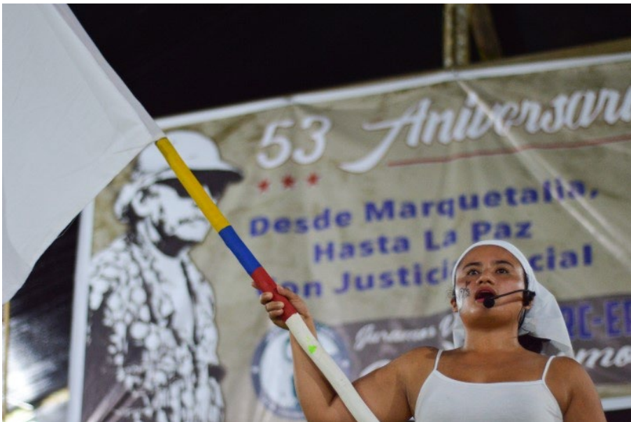
Ilustración 3. Colinas, Guaviare, 2017.

Durante los días de la conmemoración se destacaron diferentes propuestas artísticas y culturales de grupos provenientes de Bogotá, Arauca y de la misma Zona Veredal. El clima de posacuerdo permitió que muchas personas de estas delegaciones, sobre todo los asistentes ciudadanos, tuvieran contacto por primera vez con personas pertenecientes a una “guerrilla”, y encontraran en la conmemoración formas concretas de aportar. Un dato llamativo, a propósito, estuvo en una de las artistas provenientes de Bogotá que evitó el nombre que comúnmente usa su personaje artístico para presentarse con el nombre de “Paz Estresada”.