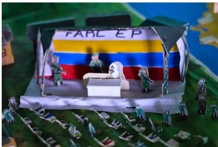
Ilustración 2. Colinas, Guaviare, 2017.