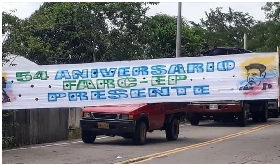
Ilustración 5. Disidencias de las FARC instalaron pancartas y bloquearon vías en Arauca.